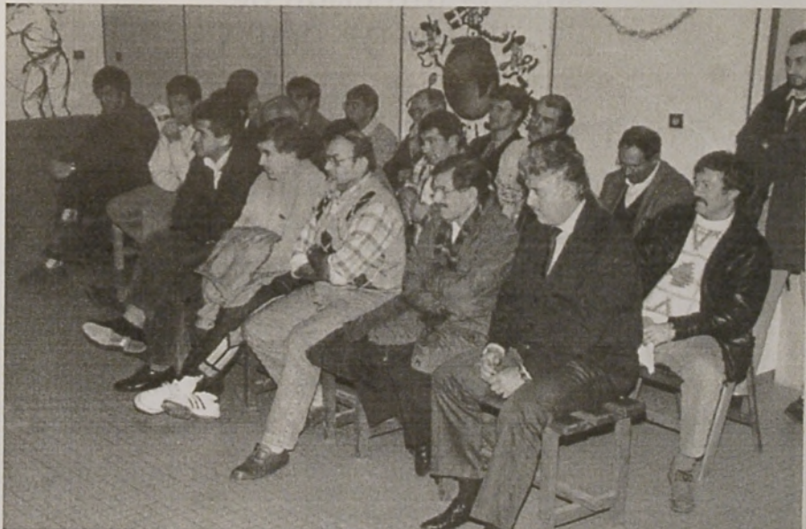
Assemblée Générale du 13 janvier 1995 à Cestas

Enfin, lecture est faite de la convention passée entre le SAGC, la section et la mairie sur l'utilisation du trinquet. Elle est adoptée à l'unanimité moins une voix. Sur ce, les présents ont partagé la galette des rois.